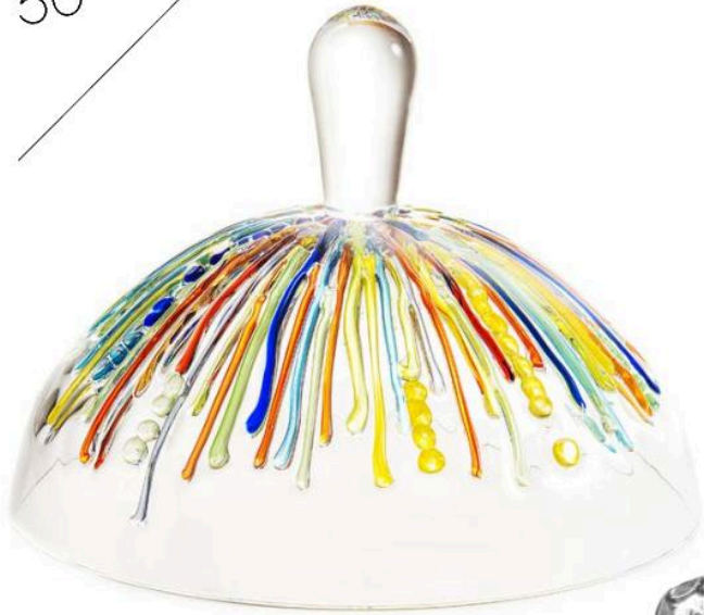
Cloche à fromages de la collection Candy, explorant la luminosité du verre à la couleur. Design Humberto et Fernando Campana. ©Lasvit