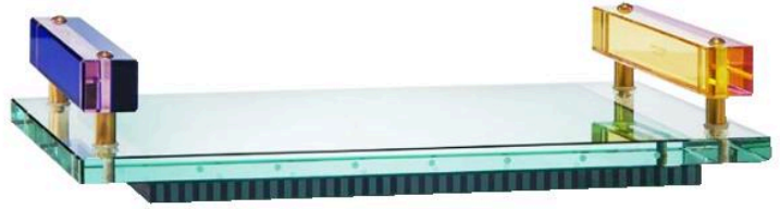
Plateau Panama Tray en cristal et verre. 40 x 26 x H 8,1 cm.