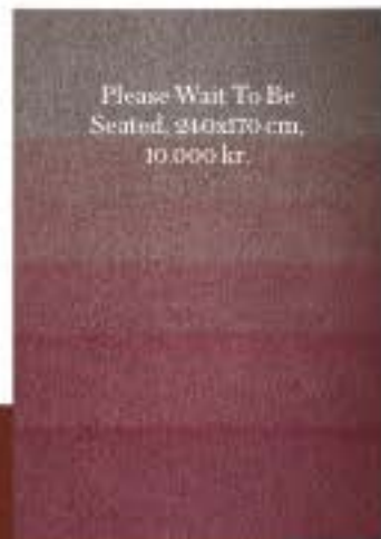
Please Wait To Be Seated, 210x170 cm, 10.000 kr.