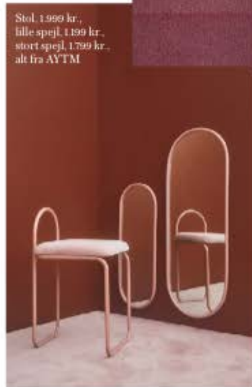
Stol, 1.999 kr., lille spejl, 1.199 kr., stort spejl, 1.799 kr., alt fra AYTM