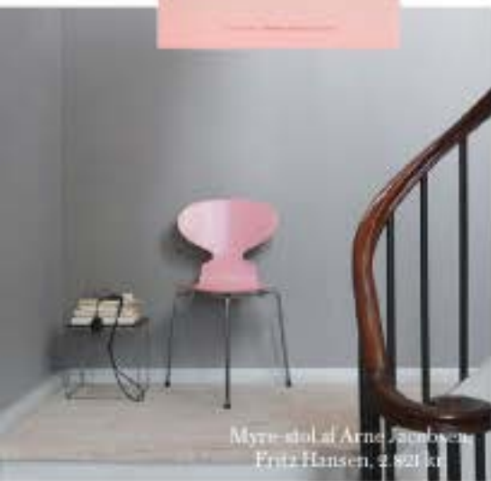
Myre-stol af Arne Jacobsen og Fritz Hansen, 2.821 kr.