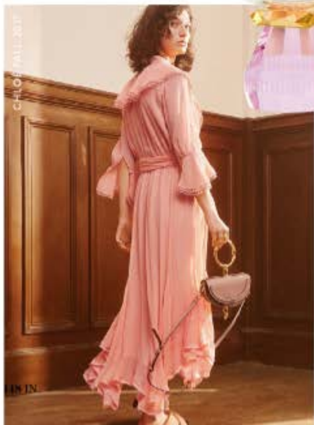
CHLOE FALL 2017