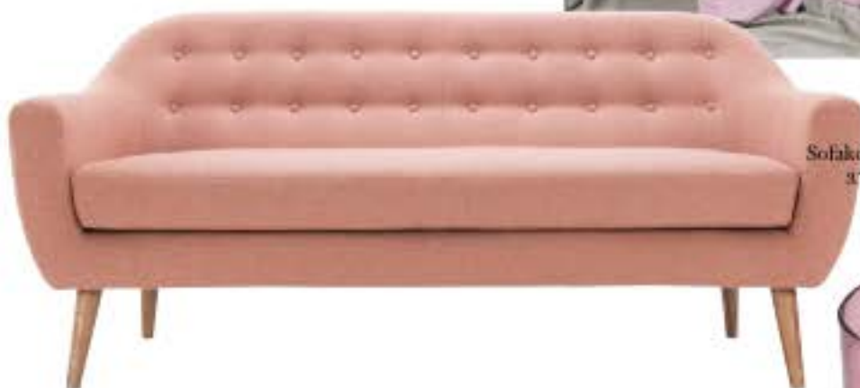
Sofakompagniet, 3.799 kr.