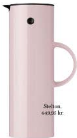
Stelton, 449,95 kr.

Lyserødt er gået fra at være candyfloss, Barbie og alt, der er ultimativt piget, til at være en modifarve, som bliver ved med at hitte. Både på catwalken og i boligen, hvor rosa tilfører noget både feminint og modigt