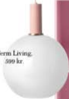
Ferm Living, 599 kr.