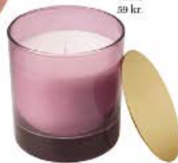
Ikea, 59 kr.