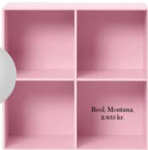
Reol, Montana, 2.895 kr.