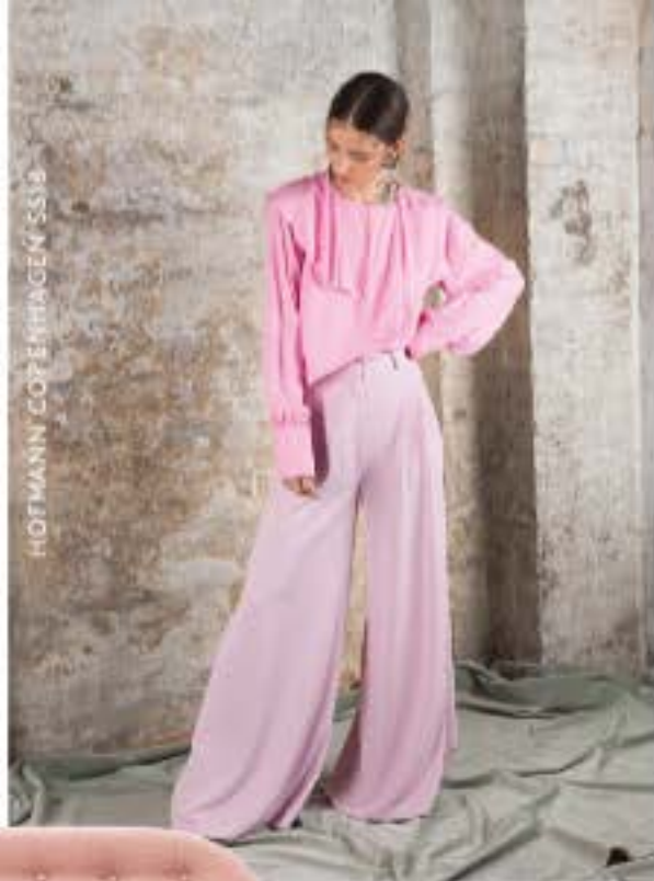
HOTMANN, COPENHAGEN, 559 kr.