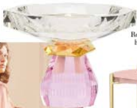
Madison Bowl fra Reflections Copenhagen hos Paustian, 2.650 kr.