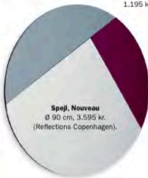
Spejl, Nouveau Ø 90 cm, 3.595 kr. (Reflections Copenhagen).