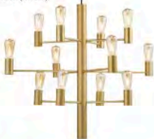
Manola-lysekrone i messing med 12 pærer. H 50 x Ø 60 cm, 3.899 kr. (Herstal).