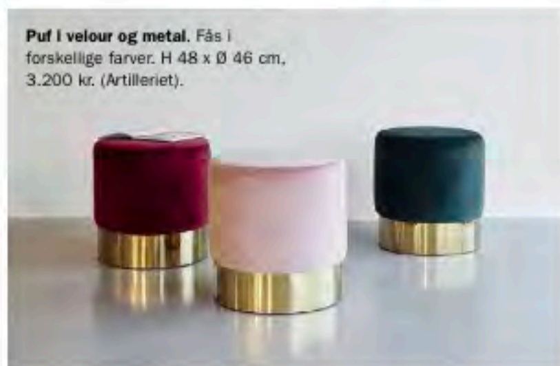
Puf i velour og metal. Fås i forskellige farver. H 48 x Ø 46 cm, 3.200 kr. (Artileriet).