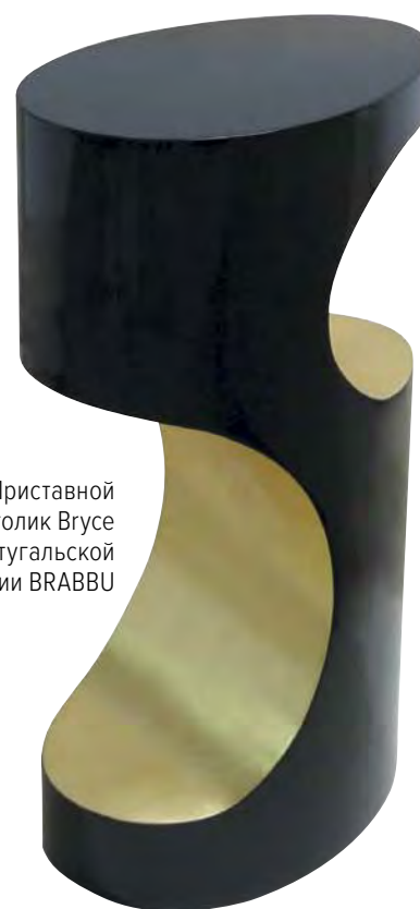
Приставной столик Vrusce от португальской компании BRABBU