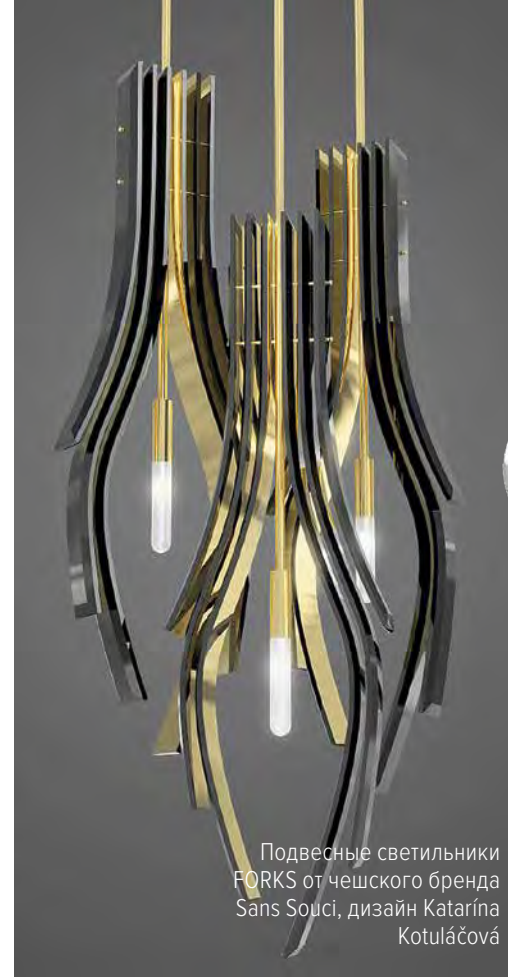
Подвесные светильники FORKS от чешского бренда Sans Souci, дизайн Katarína Kotuláčová