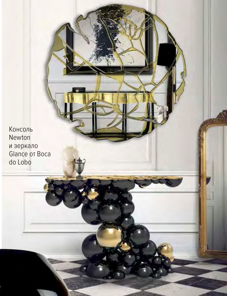
Консоль Newton и зеркало Glance от Boca do Lobo