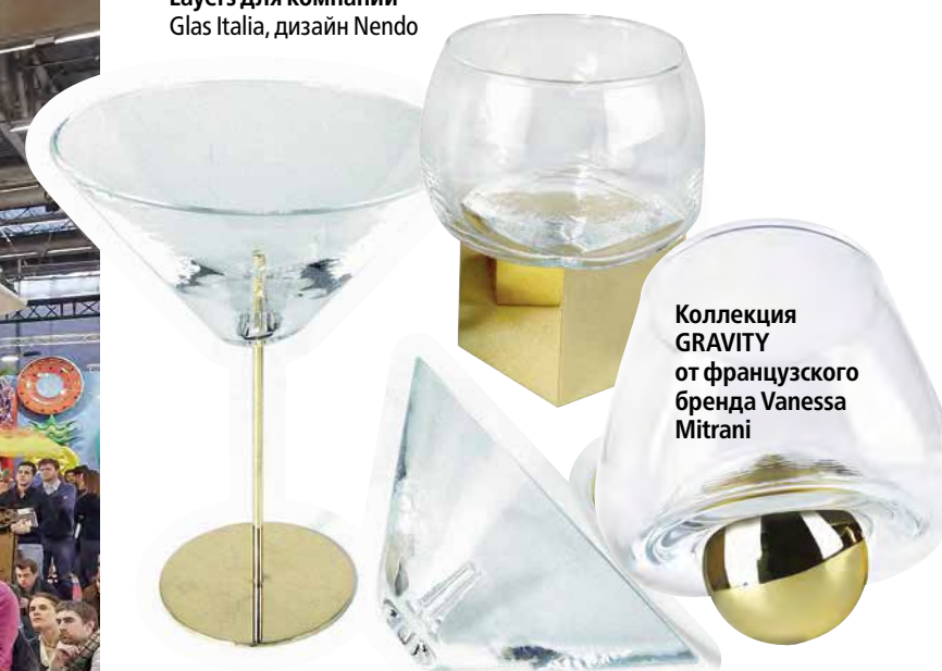
Коллекция GRAVITY от французского бренда Vanessa Mitrani