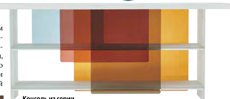
Консоль из серии Layers для компании Glas Italia, дизайн Nendo