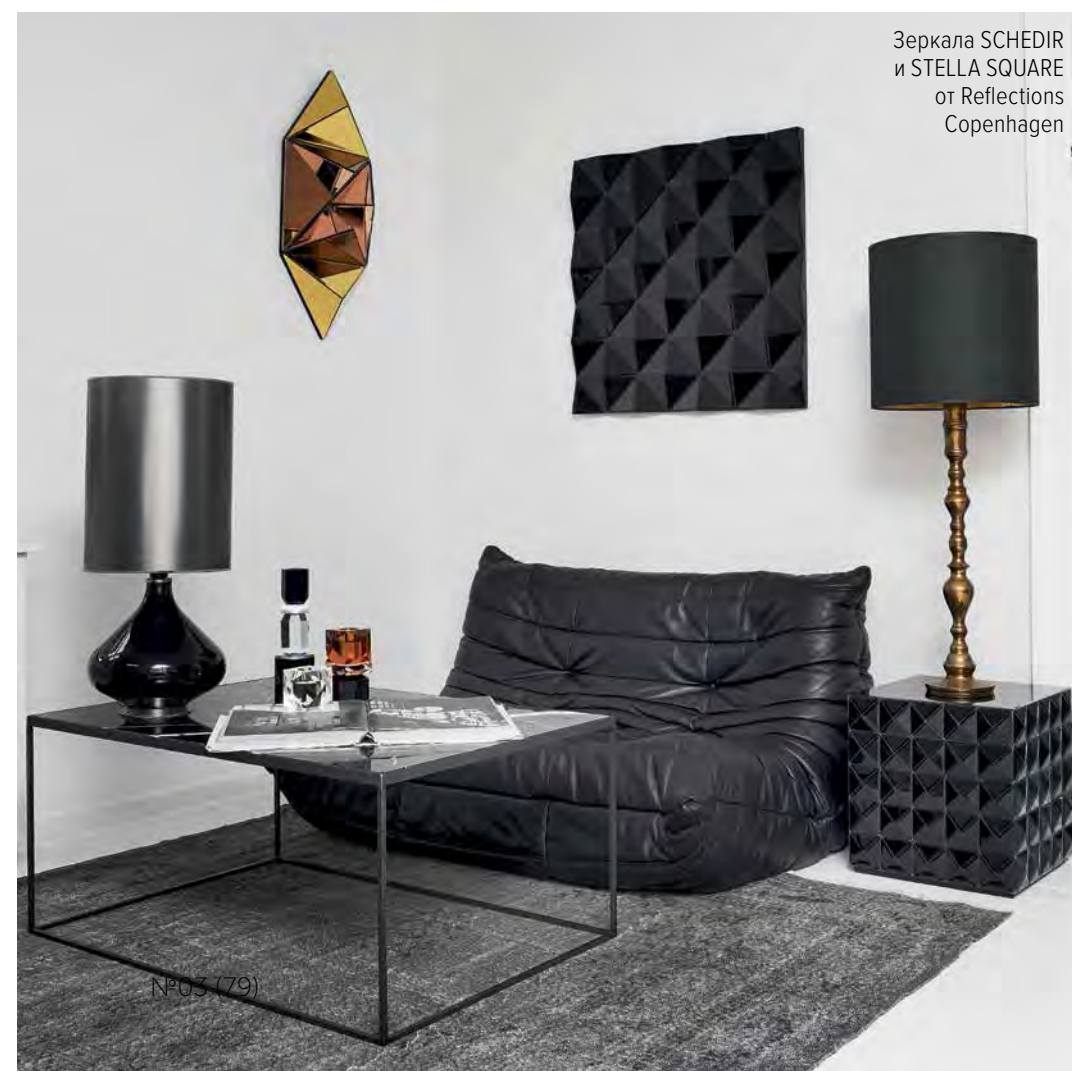
Зеркала SCHEDIR и STELLA SQUARE от Reflections Copenhagen