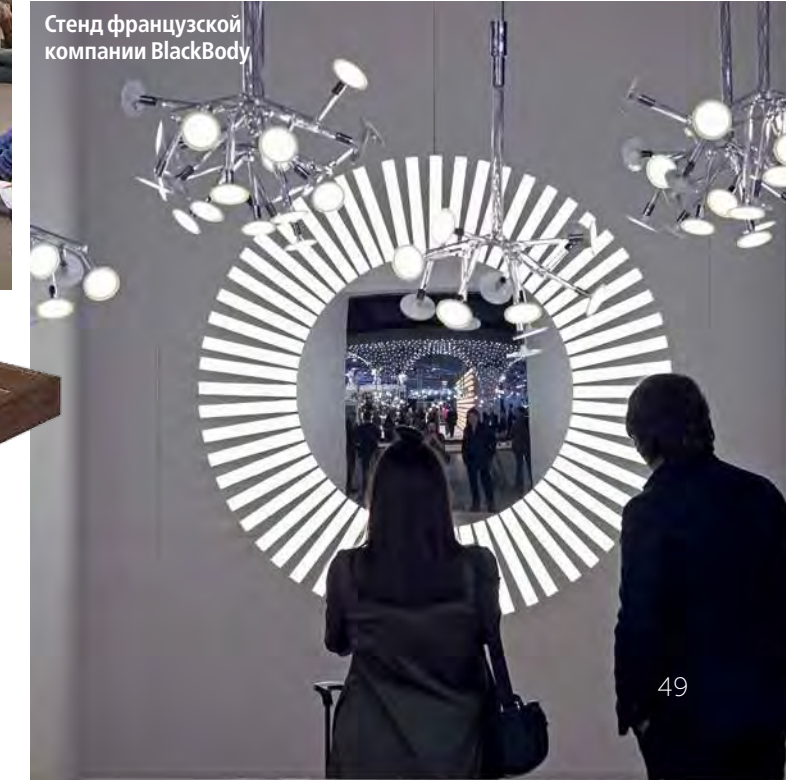
Стенд французской компании BlackBody