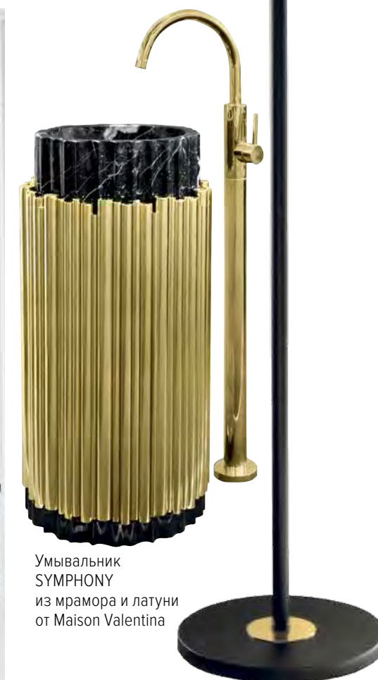
Умывальник SYMPHONY из мрамора и латуни от Maison Valentina