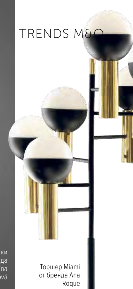
Торшер Miami от бренда Ana Roque