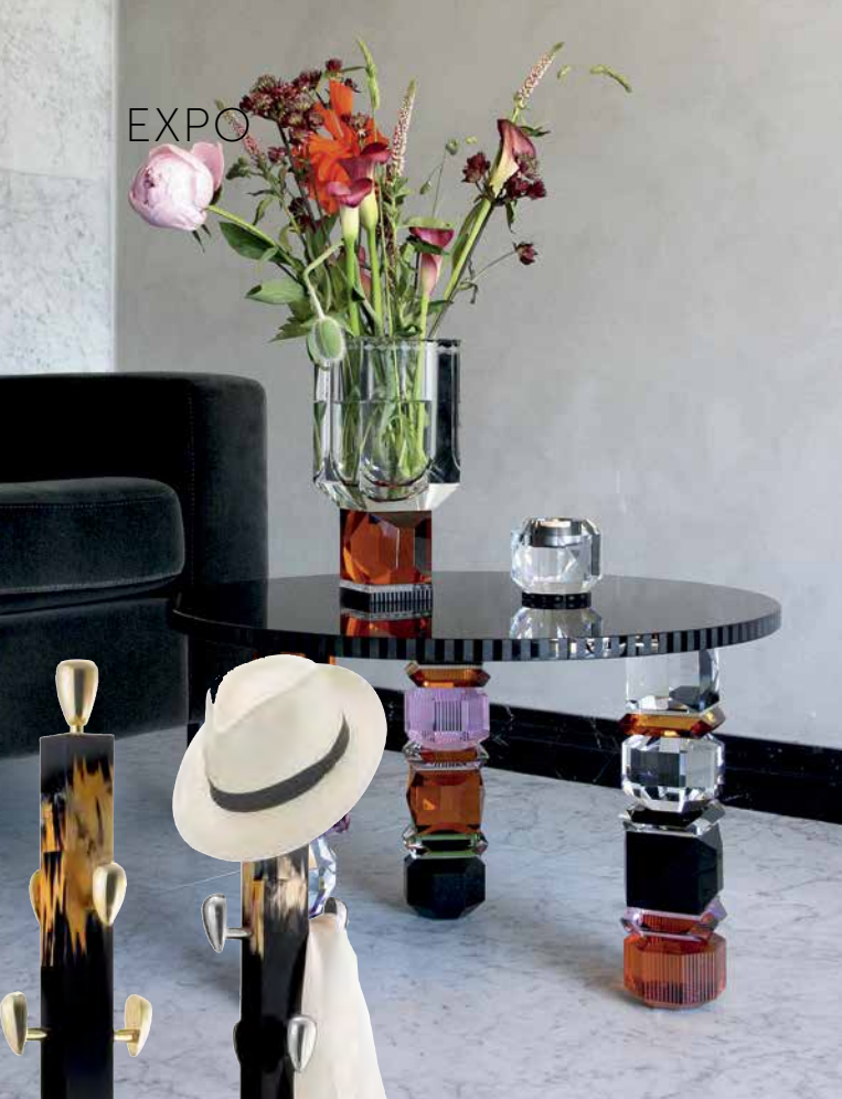
Журнальный столик ORLANDO от датского бренда Reflections Copenhagen

Несмотря на то что темой выставки стала «тишина», это последнее, что приходило голову при взгляде на буйство цвета, форм и фактур на стендах. Так, тенденция прошлого года перешагнула и в настоящий: множество экспонатов парижского салона представили на своих стендах обилие зелени – если не в обивке диванов, то в виде живого цветка в горшке. И это неудивительно, ведь негласным веянием этого года стала тема тропиков. Тропический настрой ощущается сразу при первых шагах по выставке. Экзотические растения и животные, сочные и яркие цвета присутствуют в мебели, текстиле, обоях, освещении и предметах декора. Множество брендов представили коллекции с различными вариантами пальмовых ветвей, тропических принтов, в традиционной