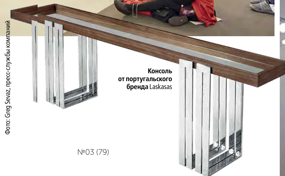
Консоль от португальского бренда Laskasas