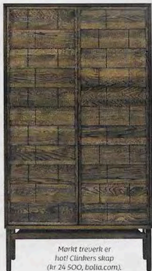
Mårt trøverk er hot! Clinkers skap (kr 24 500, bolia.com).