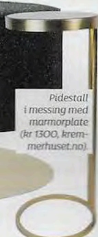
Pidestall i messing med marmorplate (kr 1300, kremmerhuset.no).