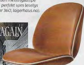
Luksurios Beetle-variant i fløyel og messing fra Cubi (kr 10 100, oslodeco.no).