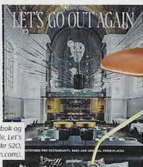
Interiørbok og restaurantguide, Let's go out again (kr 520, amazon.com).