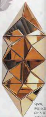
Speil, Reflecta (kr 600, eskenin- no).