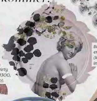
Brett som også er toft på veggen (kr 1 050, eske- interior.no).