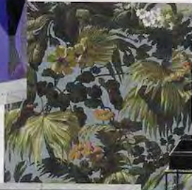
Globo box fra Jonathan Adler (kr 4300, insidetoo.no).