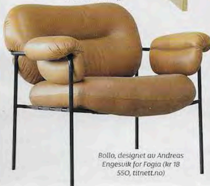
Bollo, designet av Andreas Engesvik for Fogia (kr 18 550, titnett.no)