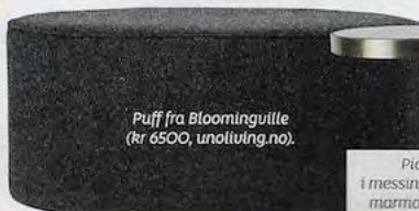
Puff fra Bloomingville (kr 6500, unoliving.no).