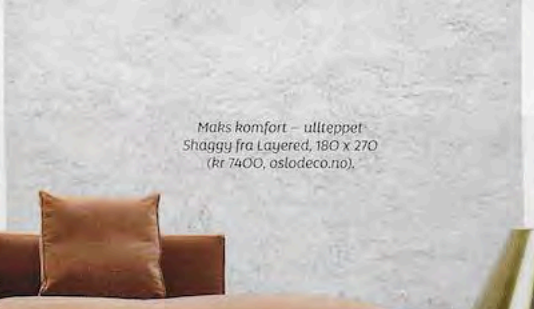
Maks komfort – ullteppet Shaggy fra Layered, 180 x 270 (kr 7400, oslodeco.no).