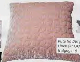
Pute fra Dirty Linen (kr 1300, frulyng.no).