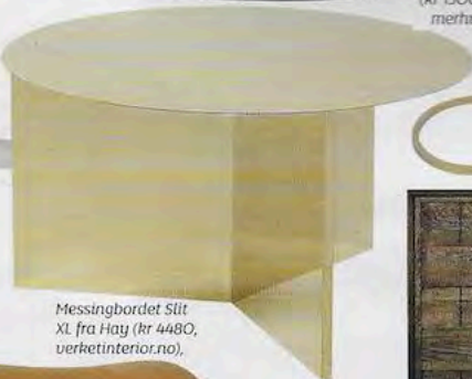
Messingbordet Slit XL fra Hay (kr 4480, verketinterior.no).