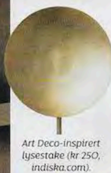
Art Deco-inspirert lysestake (kr 250, indiska.com).