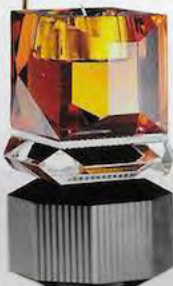
Lysestake fra Reflections (kr 1850, eskeinterior.no).