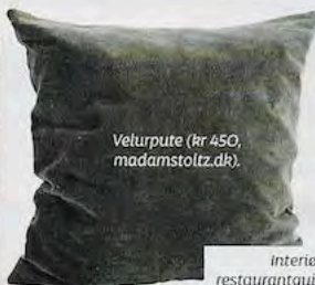
Veturpute (kr 450, madamstoltz.dk).