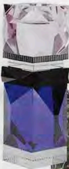
Lysstake (kr 1500, eskeinterior.no).