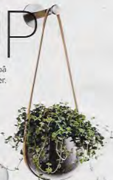
Hængokrukke i mundblæst glas med strok i kernelæder, diameter 14 cm, 450 kr. Holmegaard.