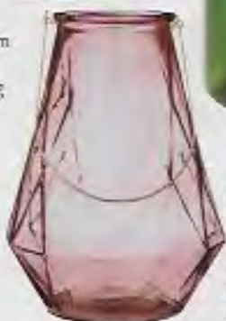
Lanterne i rosa glas med guldhæk, h 37 cm, diam 26,5/27,5 cm, 379 kr. Bloomingville.