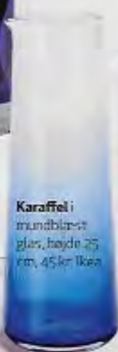
Karaffel i mundblæst glas, højde 25 cm, 45 kr. Ikea.