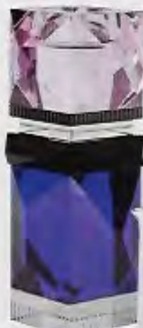
Fyrfadsstage i blå og pink, Miami Crystal, 8 x 8 x 19,8 cm, 1.600 kr. Reflections.

AF LOUISE CLEMENSEN | LÆSERSERVICE, SIDE 110