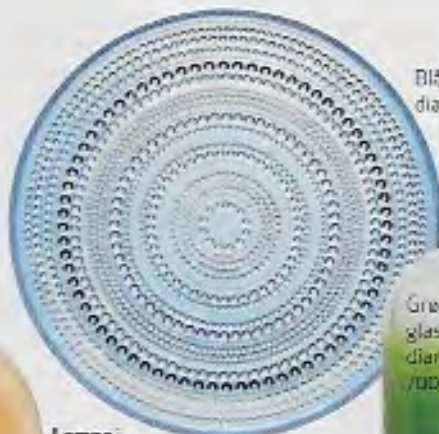
Blå tallerken i glas, Kastehelmi, diameter 315 mm, 390 kr. Iittala.