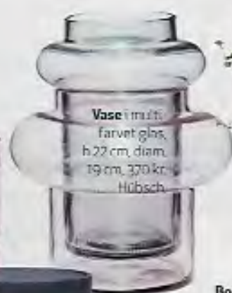
Vase i multifarvet glas, h 22 cm, diam 19 cm, 370 kr. Hübisch.