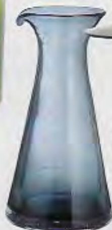
Karaffel i mundblæst glas, Bubbles, h 24 cm, diam 12,5 cm, 50 cl, 145 kr. Brastø Copenhagen.