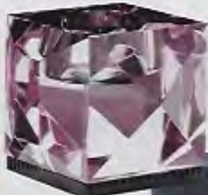
Fyrfadsstage i pink glas, Ophelia Crystal, 9 x 9 x 7,8 cm, 800 kr. Reflections.