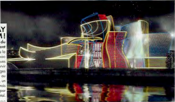
© Reflections Guggenheim Bilbao. Concept visuel robot. © 59 Productions

"J'ai imaginé les courbes du Guggenheim pour qu'elles attrapent la lumière." Vingt ans après la construction du fameux musée de Bilbao par Frank Gehry, ces gigantesques vagues de titane et de verre vont servir de support à une projection d'images visibles pendant quatre jours, du 11 au 14 octobre. C'est 59 Productions, un collectif d'artistes vidéo qui a conçu trois "habillages" différents visibles par plus de 200 000 spectateurs au total. ■ www.guggenheim-bilbao.eus